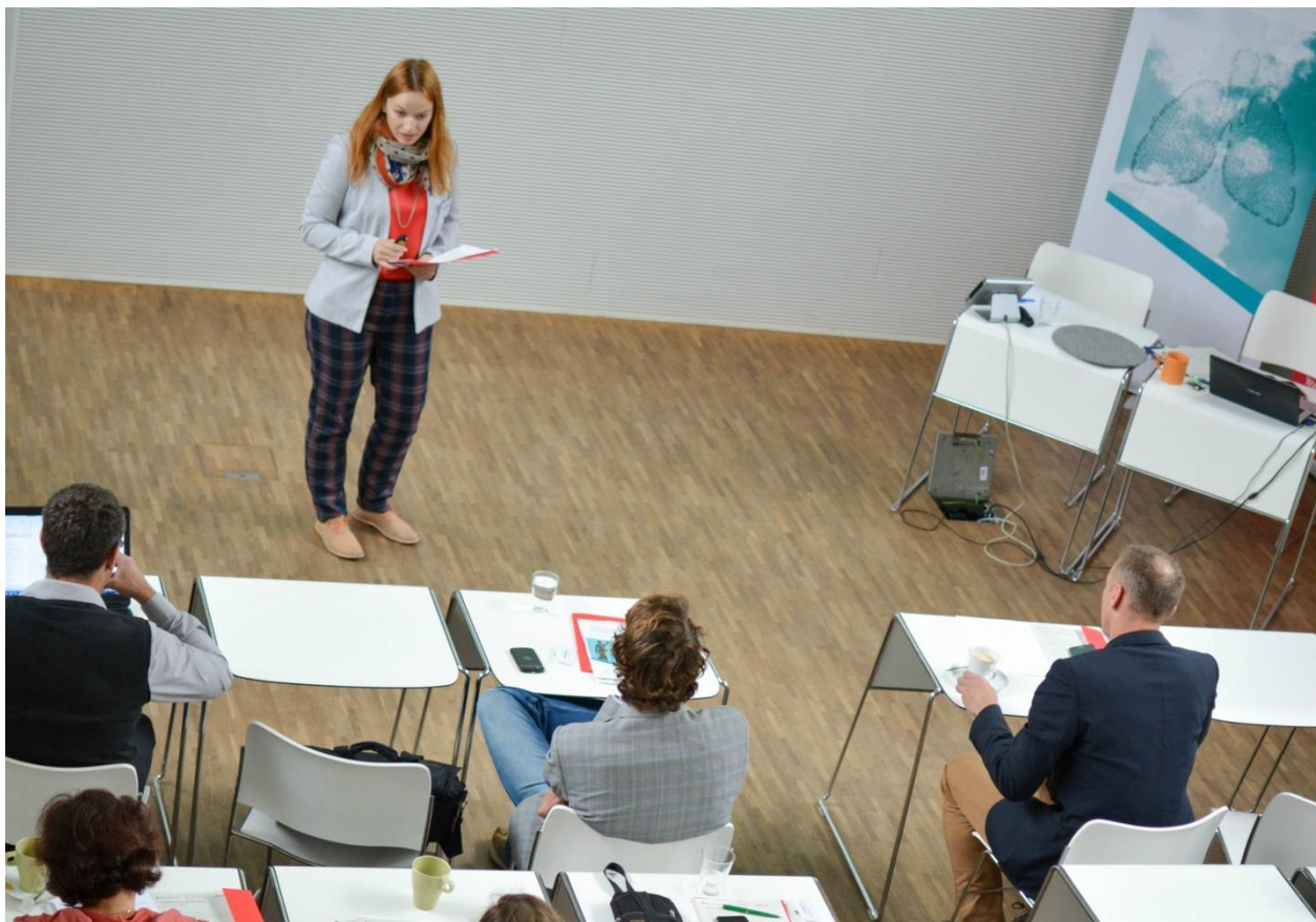
Seminář Zlepšování kvality ovzduší v obcích proběhl v Brně v září 2017.

V dalších oblastech Polska se účastníme přípravy nových programů zlepšování kvality ovzduší a poskytujeme poradenství lokálním partnerům a spolupracujeme se samosprávami.