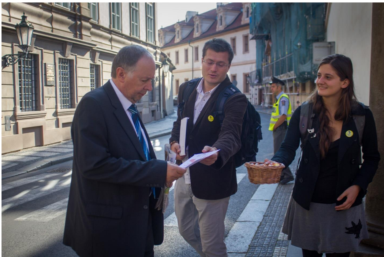
Kampaň za záchranu zákona o registru smluv. www.frankbold.org

Tato kampaň byla politiky velmi citlivě vnímána, jelikož byli osobně konfrontováni se svým hlasováním, které převážná část veřejnost vnímala velmi negativně. Zároveň jsme vyjeli do regionů s kampaní „Chceme to vidět!“, během které jsme občany informovali o aktuální hrozbě okleštění zákona. Celá tour byla zakončena „Happeningem za 150 mld.“ na Malostranském náměstí v předvečer hlasování.