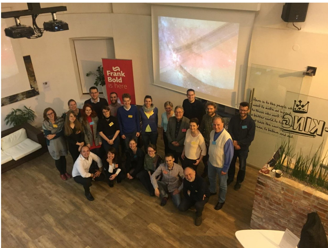
Setkání partnerů z lokálních spolků a iniciativ v ostravském v Impact Hubu 4. listopadu 2017.

Zásobovali jsme informacemi a radami síť 4 000 Občanů 2.0, tedy aktivních občanů, kteří se zajímají o dění kolem sebe a zapojují se do něj. Ti v roce 2017 dostali 5 „Zpravodajů 2.0“ s informacemi o aktuálních úspěšných kauzách a 9 „Rádců 2.0“ s právními radami a návody. Občané 2.0 mají také možnost účastnit se pravidelných setkání s přednáškami a výměnou zkušeností. V roce 2017 bylo setkání zaměřeno zejména na novelu stavebního zákona a zákona o posuzování vlivů na životní prostředí.